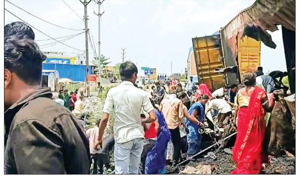
देवास। वाहनों में लगी आग बुझने के बाद सामान समेटने में जुटे लोग।

आग बुझते ही बोरे में भरकर सामान ले गए लोग