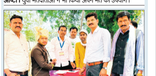
आष्टा। ग्राम मोलुखेड़ी में दूल्हे ने पहले किया मतदान।