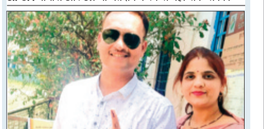
आष्टा। युवा मतदाताओं ने भी किया अपने मत का उपयोग।