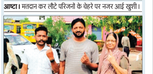
आष्टा। परिवार के साथ पहुंचकर किया मतदान।