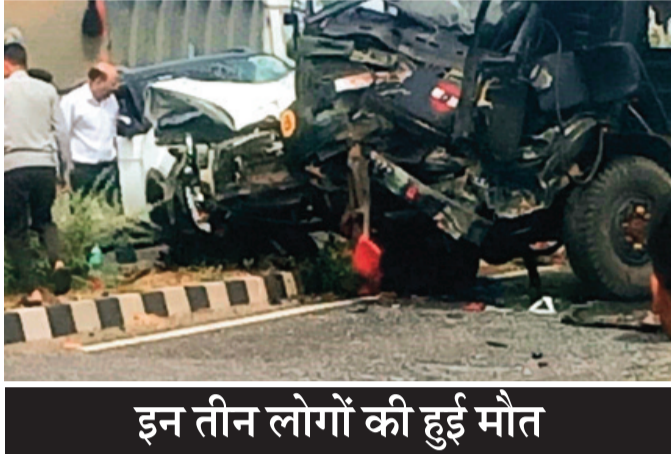
इन तीन लोगों की हुई मौत

नेशनल हाईवे पीलूखेड़ी जयपुर जबलपुर हाईवे पर सोमवार सुबह तकरावन 9 बजकर 30 बजे के लगभग आर्मी वाहन को ओवर टेक करती हुई कार के टकराने से आर्मी ट्रक डिवाइडर तोड़ते हुए दूसरी ओर जाने से और बस से टकराने से 3 लोगों की मौत और 17 लोग घायल हो गए हैं। जानकारी के अनुसार भोपाल जा रही कमला बस का एक्सिडेंट उस समय हुआ जब दूसरी ओर डिवाइडर तोड़कर आने वाले आर्मी वाहन बस से जा टकराया। इस घटना में आर्मी जवान सहित दो पैसंजर की मौके पर मारे गए व अन्य 17 घायल हो गए। मौके पर पहुंची पुलिस ग्रामीण क्षेत्र के लोगों ने एक्सिडेंट को देखते हुए सभी पैसंजरो को गाड़ी से बाहर निकाला यथा स्थिति को समझते हुए थाना कुरावर को सूचना दी थाना प्रभारी एवं अन्य स्टाफ को लेकर मौके पर पहुंचे आर्मी हेडक्वार्टर आर्मी जवानों के कमांडर भी मौके पर आए गाड़ी का सुप्रतनामा बना कर थाना प्रभारी को देकर गाड़ी को अपने साथ ले गए थाना कुरावर जांच में जुटा।