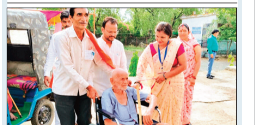
आष्टा। बीमारी और उम्र भी मतदान करने से नहीं रोक सकी।