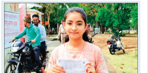
आष्टा। पहली बार अपने मत अधिकार का किया उपयोग।