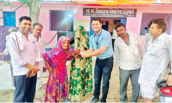
हरिभूमि न्यूज | आगर-मालवा

लोकसभा संसदीय क्षेत्र देवास के विधानसभा क्षेत्र आगर (अजा) में सोमवार को सभी मतदान केन्द्रों पर शांतिपूर्ण मतदान सम्पन्न हुआ। विधानसभा क्षेत्र में 75.44 प्रतिशत मतदान हुआ। जिसमें 79.68 प्रतिशत पुरुष एवं 70.97 प्रतिशत महिला मतदाताओं ने मतदान कर अपनी नैतिक जिम्मेदारी निभाई। जिले के मतदाताओं में मतदान को लेकर अपार उत्साह देखा गया, प्रातः समय से मतदाता अपनी नैतिक जिम्मेदारी निभाने के लिए मतदान केन्द्रों पर पहुंचने लगे, युवा, बुजुर्ग, दिव्यांग महिला-पुरुष सभी मतदाताओं द्वारा अपने वोट देकर अपना फर्ज निभाया। विधानसभा क्षेत्र आगर में सुबह 9 बजे 18.56 प्रतिशत मतदान, 11 बजे 37.66 प्रतिशत, दोपहर 1 बजे 52.53 प्रतिशत, 3 बजे 63.45 प्रतिशत तथा शाम 5 बजे 72.34 प्रतिशत मतदान हुआ है।