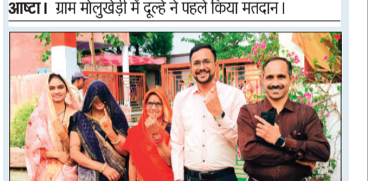
आष्टा। मतदान कर लौटे परिजनों के चेहरे पर नजर आई खुशी।